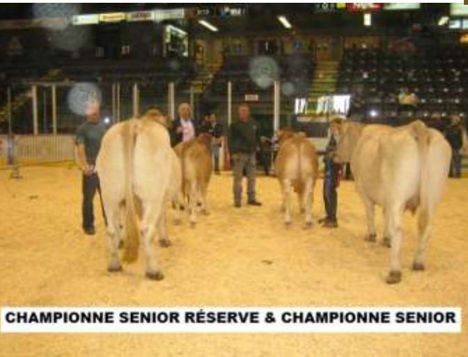
CHAMPIONNE SENIOR RÉSERVE & CHAMPIONNE SENIOR