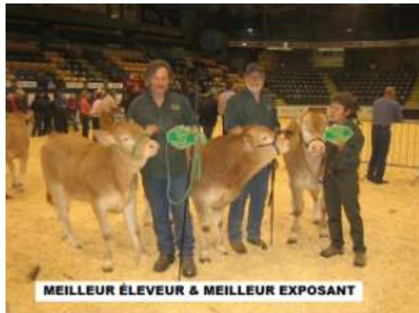
MEILLEUR ÉLEVEUR & MEILLEUR EXPOSANT