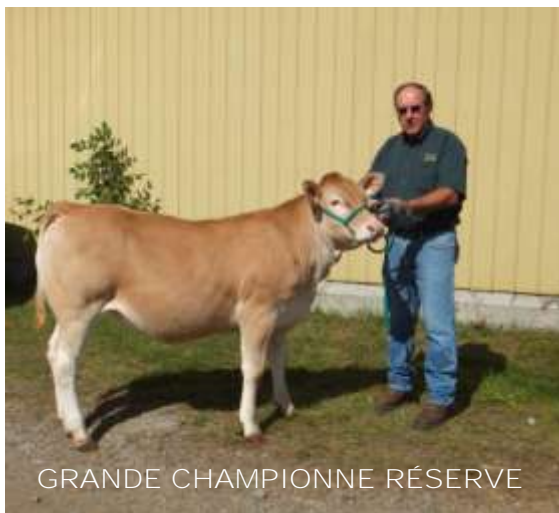
GRANDE CHAMPIONNE RÉSERVE