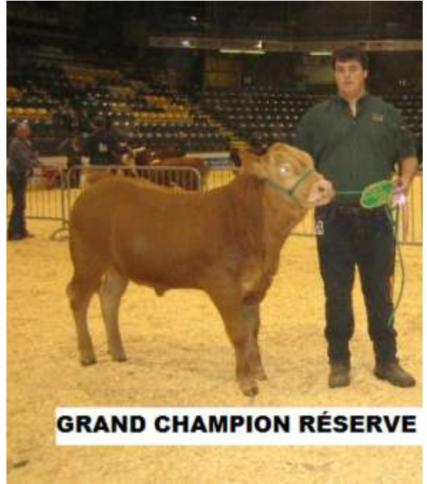
GRAND CHAMPION RÉSERVE