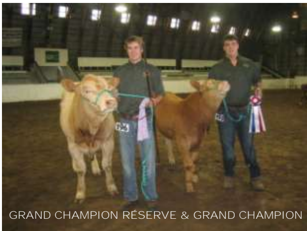
GRAND CHAMPION RÉSERVE & GRAND CHAMPION