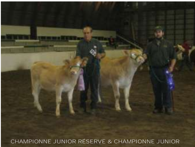
CHAMPIONNE JUNIOR RÉSERVE & CHAMPIONNE JUNIOR