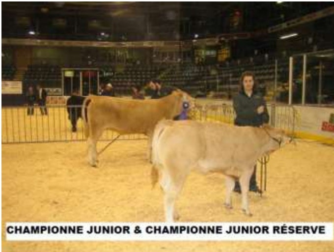
CHAMPIONNE JUNIOR & CHAMPIONNE JUNIOR RÉSERVE